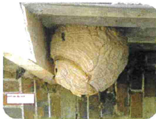
Nid secondaire Sphérique à piriforme Environ 70 cm de diamètre Petite ouverture latérale Arbres, à plus de 10 m (75 % des cas)