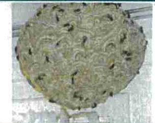
Nid de guêpe 30 cm, petite ouverture vers le bas

Groupement de Défense Sanitaire de l'Eure Contact plateforme départementale :