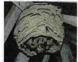
Nid de frelon européen 30 cm, large ouverture vers le bas