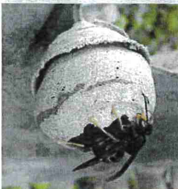
Nid primaire sphériques, 10 cm, endroit abrité

reconnaître un nid de frelon asiatique parmi d'autres nids